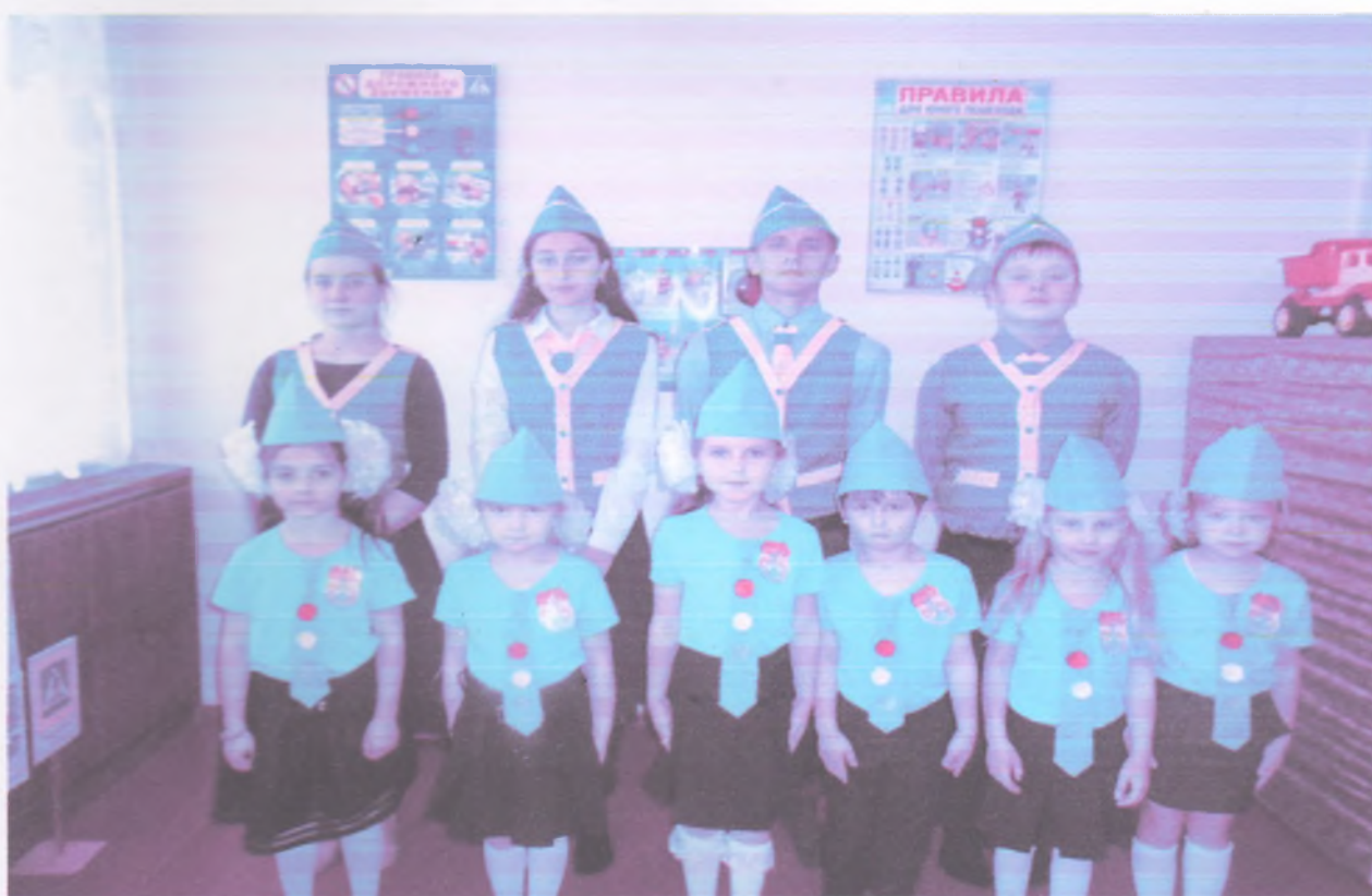
План основных мероприятий резервного отряда ЮИД «Светофорик»: