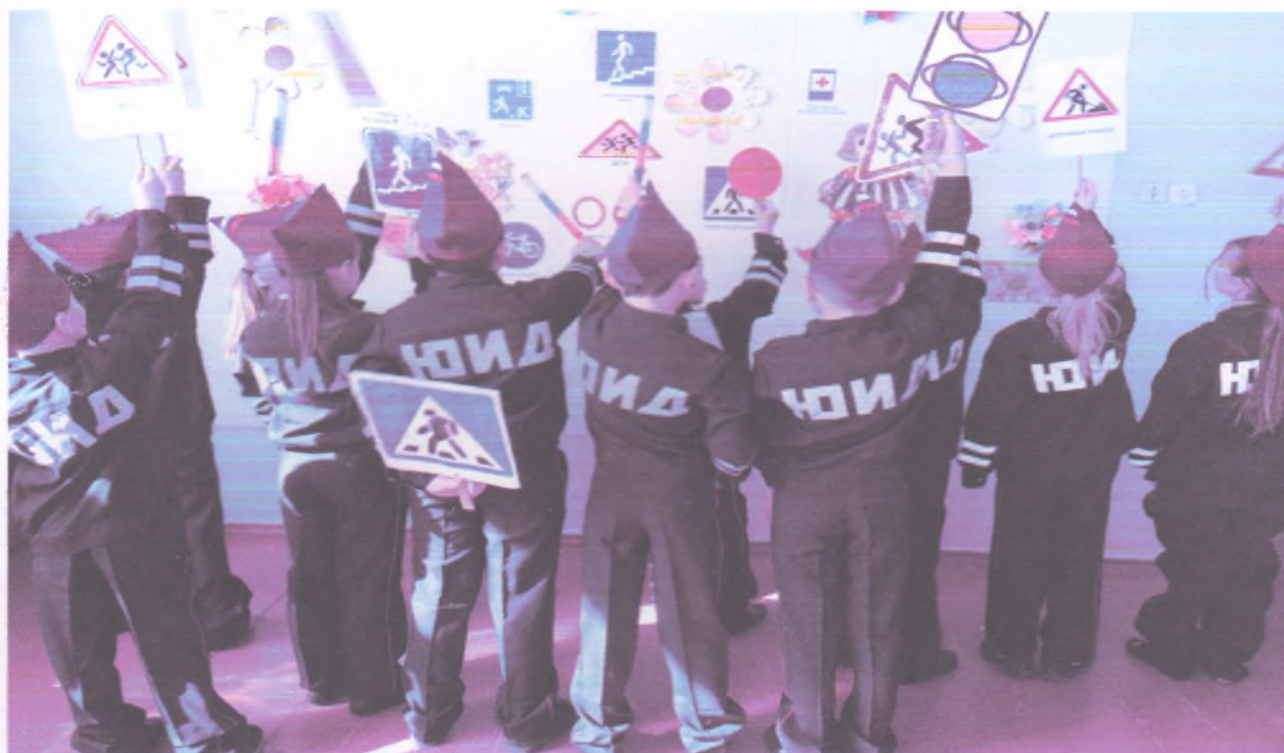
Эмблема отряда ЮИД: